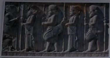
Obr. 23 – Perští vojáci na reliéfu v Persepoli, jednom z center perské říše.

Právě Spartané a jejich král Léonidas měli svěřeno hlavní velení. Řekové chtěli zastavit perský postup u Thermopyl , ale byli poraženi. (→ Obr. 22) Athéňané se však Xerxovi nepodrobili. Raději vyklidili rodné město a postavili se na odpor v průlivu mezi Attikou a ostrovem Salamína . (→ Obr. 24, 25) Došlo k námořní bitvě, ve které athénské loďstvo porazilo perskou přesilu a Xerxés se s většinou vojska vrátil do Asie. Perská armáda následujícího roku 479 př. n. l. znovu vpadla do Řecka. Došlo k bitvě u Platají , během níž Řekové zabili perského velitele a Peršané se dali na útěk.