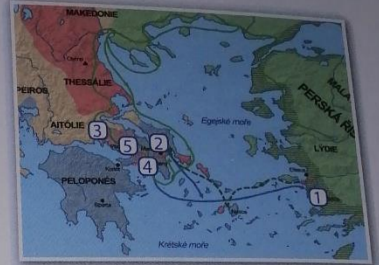
Obr. 20 – Řecko-perské války 1 – Milétos, 2 – Marathón, 3 – Thermopyly, 4 – Salamína, 5 – Plataje