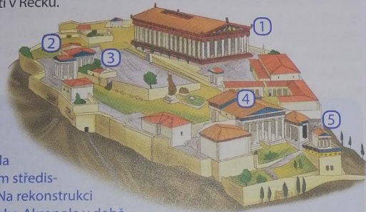
Obr. 28 – Athénská Akropole

Athény měly k dispozici značné finanční prostředky jednak ze stříbrných dolů, jednak z cel vybraných v přístavech a také z příspěvků plynoucích do pokladny athénského námořního spolku, který se postupně přeměnil v námořní říši, v níž měly rozhodující slovo Athény. V době, kdy již nebylo třeba tyto peníze vynakládat na válečná tažení proti Peršanům, rozhodli se z nich Athéňané platit rozsáhlou stavební činnost . Bylo vybudováno mohutné opevnění kolem města , nedlouho předtím založený přístav Pireus byl spojen s městem tzv. doluhými zdmi – hradbou, která chránila cestu spojující přístav s městem. Také byly obnovovány chrámy zničené Peršany v době řecko-perských válek a znovu vybudována byla Akropole s mohutným chrámem Parthenónem . (→ Obr. 28) Athény se v této době staly také nejvýznamnějším střediskem umění, kultury a vzdělanosti v Řecku.