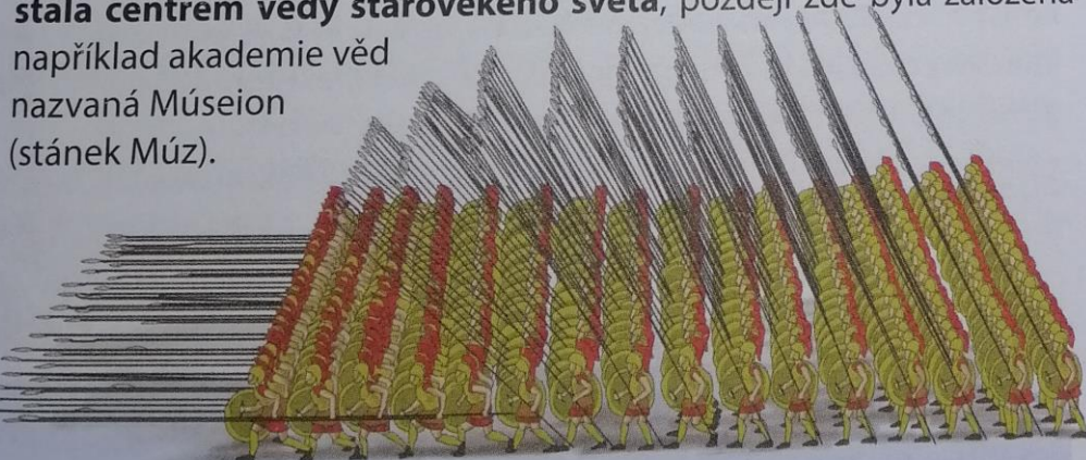
Obr. 35 – Falanga

Alexandrovo vojsko se střetlo s Peršany nejprve v bitvě u Grániku , kde zvítězilo, a Alexandr ovládl téměř celou Malou Asii. Následovala další bitva u Issu (→ Obr. 38), kde byli Peršané zahnáni na útěk a perský král Dáreios III. zanechal na bojišti nejen svůj válečný stan s mnohými poklady, ale i manželku a dcery. Makedonské vojsko se zmocnilo Sýrie, Foinikie, Palestiny a vtáhlo do Egypta , který patřil také Persii. Zde byl Alexandr vítán jako osvoboditel a prohlášen za faraona. U ústí nilské delty založil Alexandrii , první a nejproslulejší z měst, která nesla jeho jméno. Alexandrie se stala centrem vědy starověkého světa , později zde byla založena například akademie věd nazvaná Múseion (stánek Múz).