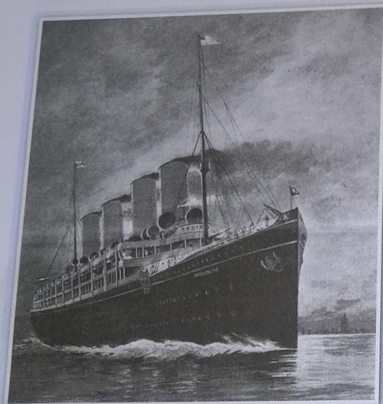
Obr. 7 – Parník Deutschland [dojčland] Tato loď získala celkem čtyřikrát takzvanou Modrou stuhu, cenu pro loď, která v daném roce nejrychleji přeplula trasu z Evropy do Ameriky (v roce 1904 to Deutschland dokázal za 5 dní, 11 hodin, 54 minut). V roce 1908 již němečtí rejdaři vlastnili druhé největší obchodní loďstvo na světě, hned po britském.

Zjisti, jak dlouho dnes trvá cesta lodí z Evropy do Ameriky.