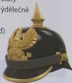
Obr. 2 – Pruská helma