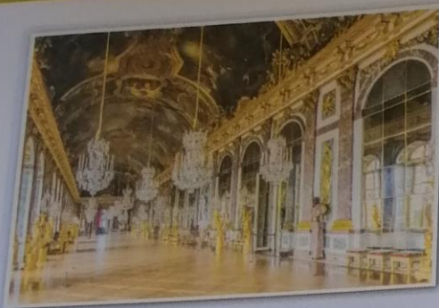
Obr. 5 – Zrcadlový sál ve Versailles Během obléhání Paříže sídlilo ve Versailles nejvyšší pruské velení, proto zde došlo k vyhlášení Německého císařství.