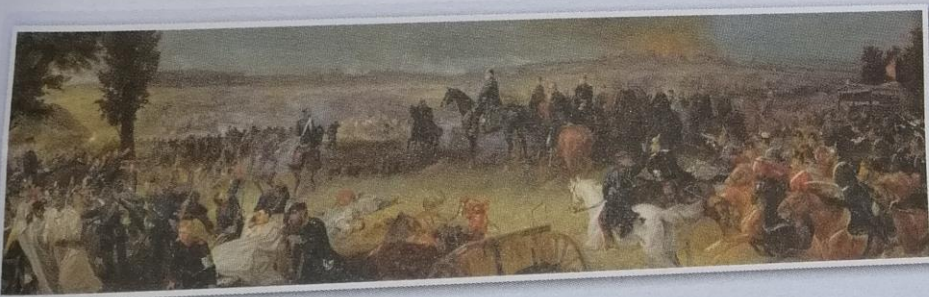
Obr. 3 – Bitva u Hradce Králové

Nejprve došlo roku 1864 k válce s Dánskem , v níž Prusko společně s Rakouskem obsadily sporná území Šlesvicko a Holštýnsko, které připojily k Německému spolku. Následné spory o správu těchto území vedly k válečnému střetu mezi bývalými spojenci Pruskem a Rakouskem. Dobře vycvičené, organizované a vyzbrojené pruské vojsko mělo od počátku převahu. Navíc se Rakousko současně octilo ve válce s Itálií, která se stala spojencem Pruska. Bismarck také zajistil neutralitu Francie dohodou s císařem Napoleonem III. Rozhodující bitva prusko-rakouské války se odehrála 3. července 1866 u Hradce Králové (→ Obr. 3). Prusové zvítězili , a tak se jim otevřela cesta na Prahu, kterou obsadili bez boje, a na Vídeň. Bismarck ovšem zastavil další postup pruských vojsk, nechtěl Rakousko zničit, naopak s ním počítal jako s budoucím spojencem. V rámci mírových smluv došlo k rozpuštění Německého spolku a Prusko získalo další území. Byl vytvořen Severoněmecký spolek v čele s Pruskem , který sdružoval státy severně od Mohanu (→ Obr. 4). Rakousko navíc, ačkoli na jihu porazilo italské vojsko, muselo Itálii postoupit Benátsko. V důsledku této války Rakousko navždy ztratilo vliv na německý a severoitalský prostor . Další důsledky měla válka pro rakouské dějiny, jak se dozvíte v dalších kapitolách (→ s. 92).