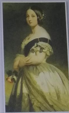
Obr. 1 – Královna Viktorie Viktorie nastoupila na trůn ve svých 18 letech (portrét pochází z doby, kdy bylo královně 23 let) a vládla více než 63 let .