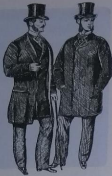
Obr. 6 – Sherlock Holmes [šerlok holms] Příběhy nejslavnějšího detektiva všech dob jsou zasazeny do Londýna viktoriánské doby.

Ve viktoriánské době se prosadil mezi zámožnými vrstvami společnosti vzor muže – gentlemana s upraveným zevnějškem (k němu patřil klobouk, vycházková hůl a kravata) a seriózním chováním.