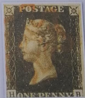
Obr. 4 – První poštovní známka na světě – Penny Black [blek]

Původní systém, kdy poštovní platil adresát a částka se odvíjela například i od vzdálenosti, byl poprvé nahrazen v roce