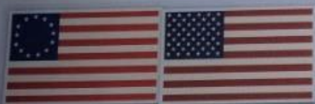
Obr. 2 – Vlajka Spojených států z roku 1777 (vlevo) a současná vlajka (vpravo)

Obr. 1 – Rozšiřování Spojených států amerických Původní území Spojených států sahalo k řece Mississippi. Když v roce 1803 potřeboval Napoleon krýt náklady na zbrojení, nabídl Spojeným státům ke koupi francouzskou Louisianu [luzjizjanu]. Později odkoupily Spojené státy od Španělů Floridu. Válkou s Mexikem získaly Texas, Nové Mexiko a Kalifornii. Smlouvou s Velkou Británií byla vytyčena hranice mezi Kanadou a Spojenými státy v oblasti Velkých jezer a dále 49. rovnoběžkou až k Tichému oceánu. V roce 1867 koupily Spojené státy Aljašku od ruského cara.