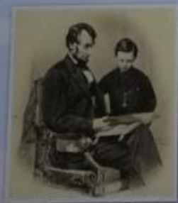
Obr. 3 – Abraham Lincoln předčítající z bible svému synovi Tedovi