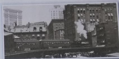
Obr. 8 – New York v roce 1899 Koncem 19. století se objevují v Americe první mrakodrapy, budují se nadzemní elektrické dráhy.