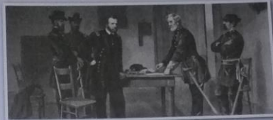
Obr. 5 – Podepsání kapitulace Po závěrečných bojích, které proběhly v dubnu 1865 na řece Appomattox, se sešel generál Unie Ulysses S. Grant a generál Konfederace Robert E. Lee [li], aby podepsali kapitulaci listinu.

V průběhu 19. století Spojené státy americké postupně zvětšovaly svou rozlohu a stala se z nich hospodářská velmoc. Původní obyvatelstvo – indiáni – bylo postupně přesídlováno a některé indiánské kmeny byly téměř vyhubeny. Neshody ohledně otrokářství mezi severními a jižními státy vedly k občanské válce, která skončila vítězstvím Severu a zrušením otroctví na celém území Spojených států. Neplnoprávné postavení černošského obyvatelstva však trvalo ještě ve 20. století.