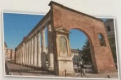
Obr. 28 – Milán Mediolanum, dnešní Milán, byl v době stěhování národů sídelním městem západorímských císařů .