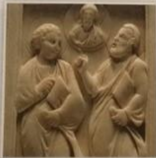
Obr. 18 – Kalixtovy katakomby

Sobota byla v židovské tradici dnem odpočinku. Římský svět takovýto den odpočinku neznal. Pravděpodobně již v dobách apoštola Pavla vznikl zvyk sváteční neděle jako památky na Ježíšovo vzkříšení.