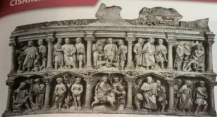
Obr. 16 – Římský sarkofág

Na tomto římském sarkofágu ze 4. století n. l. vidíme sochařské vyobrazení příběhů ze Starého i Nového zákona. V prostředním poli v horní řadě je vyobrazen Kristus s apoštoly Petrem a Pavlem, uprostřed dolní řady je umělecky ztvárněn Kristův příjezd do Jeruzaléma.