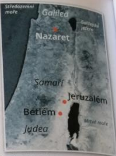
Obr. 14 – Palestina v 1. století n. l.

Palestina Oblast Palestiny se v průběhu 1. století př. n. l. dostala pod nadvládu Římské říše. (→ Obr. 14) V době principátu se zde zrodilo nové náboženství, které vycházelo, stejně jako náboženství Židů, ze Starého zákona. Židovské náboženství, judaismus, bylo monoteistické – vyznávalo jediného Boha. Součástí náboženských představ byla také víra v příchod Spasitele, Mesiáše, který přinese záchranu utlačovaným lidem. Tato víra se stala základem pro vznik křesťanství.