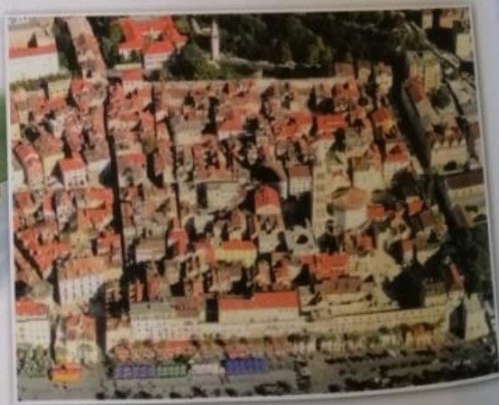
Obr. 20 – Split

V roce 305 n. l. se vzdal Diocletianus vlády a uchýlil se do rozsáhlého paláce vybudovaného v dnešním Splitu.