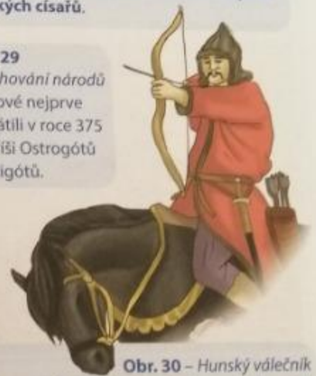
Obr. 30 – Hunský válečník

– Stěhování národů Hunové nejprve vyvrátili v roce 375 n. l. říši Ostrogótů a Vizigótů.