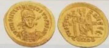
Obr. 36 – Solidus Romula Augustula Poslední císař západořímské říše nesl symbolicky jméno bájného zakladatele Říma Romula. Jeho přízvisko Augustulus znamenalo „Malý císař“ a ukazovalo nejen na mládí svého nositele, ale především na to, jak klesla vážnost císařského majestátu.

Milán, sídlení místo římských císařů, přestával být na počátku 5. století bezpečný. V roce 402 se císařský dvůr přestěhoval do Ravenny. Zde také došlo k sesazení posledního západořímského císaře Romula Augustula. Vlády se v Ravenně ujal Odoaker , ale byl později poražen ostrogótským náčelníkem Theodorichem . Ten si v Ravenně nechal zbudovat mauzoleum.