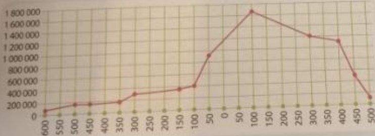
Obr. 38 – Počet obyvatel Říma

Na grafu vidíš vývoj počtu obyvatel Říma od 6. století př. n. l. až do zániku Západořímské říše.