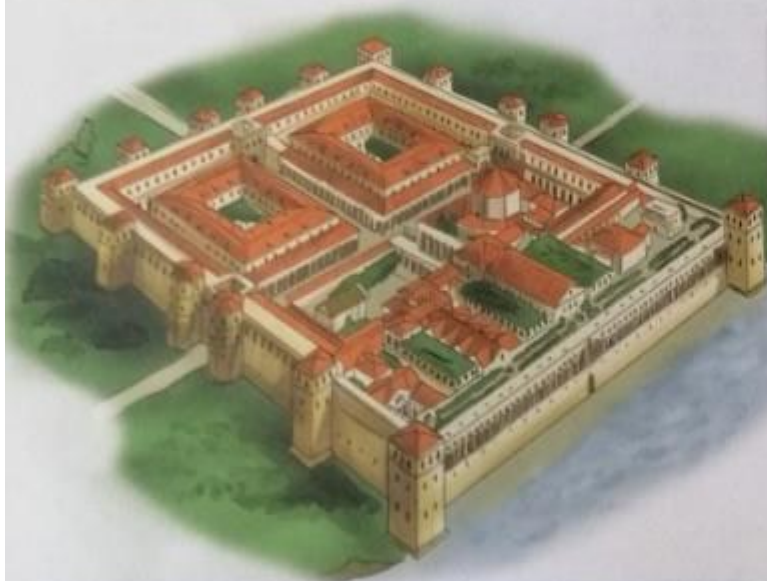
Obr. 19 – Rekonstrukce Diocletianova paláce

Císaři vadilo jednak to, že jej křesťané odmítali uctívat jako boha, jednak je považoval za brzdu svých hospodářských reforem.