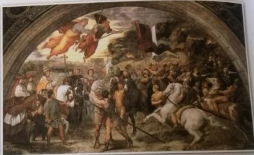
Obr. 34 – Attila

Hunové se ovšem nezastavili u Černého moře, ale pronikli dále do střední Evropy. Vedl je náčelník Attila , kterému se říkalo „ bič boží “. V roce 451 n. l. došlo k bitvě na Katalunských polích , kde se střetlo římské vojsko podporované Germány s Huny. Bitva neskončila jasným výsledkem, ovšem Attila se na čas stáhl. O rok později zaútočil přímo na Itálii a nenarazil na výraznější odpor. Vojsko Hunů ovšem zasáhl mor a tím bylo značně oslabeno, navíc Attila také zemřel. Hunové se potom stáhli. (→ Obr. 34)