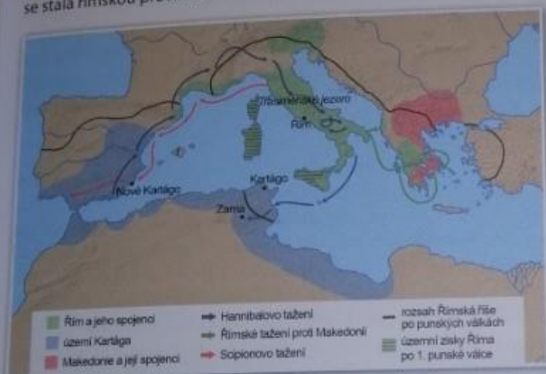
Obr. 11 – Punské války a ovládnutí Makedonie a Řecka

Římské vojsko vedené Publiem Corneliem Scipiem [publijem kornéliem] (→ Obr. 12) přešlo do protiútoku a vylodilo se v severní Africe . Hannibal byl i s vojskem povolán zpět na obranu Kartága a v roce 202 př. n. l. utrpěl jedinou, ale rozhodující porážku v bitvě u Zamy . Rok nato byl uzavřen mír, Kartágo muselo vydat válečné loďstvo, platit válečné náhrady a nemohlo bez souhlasu Říma vést žádnou válku. Hispánie se stala římskou provincií.