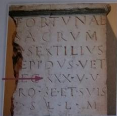
Obr. 14 – Milník

V průběhu válek tak Řím vytvořil rozsáhlou říši, která zahrnovala kromě Apeninského poloostrova také ostrovy Sicílii, Sardinii a Korsiku, Hispánii, keltská území na jihu Francie, pobřeží severní Afriky a na východě území na pobřeží Jaderského moře, Makedonii, Řecko a Malou Asii . Středozevní moře nazývali Římané Mare nostrum (česky „naše moře“), protože téměř celé jeho pobřeží bylo součástí jejich impéria . Z podmaněných území, která se stala provinciemi, získávali Římané peníze, suroviny (včetně levného obilí), otroky i vojáky do armády.