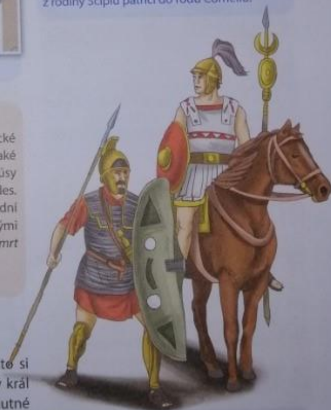
Obr. 13 – Kartaginští vojáci

– Publius Cornelius Scipio Jako úspěšnému vojevůdci z druhé punské války mu senát přičkl čestný přídomek Africanus [afrikánus]. Většina Římanů, zejména těch urozených, měla tři jména . První jméno bylo osobní (jako je naše křestní jméno), druhé jméno označovalo příslušnost k rodu a třetí jméno příslušnost k rodině. Tedy: Publius z rodiny Scipiů patříci do rodu Corneliů.