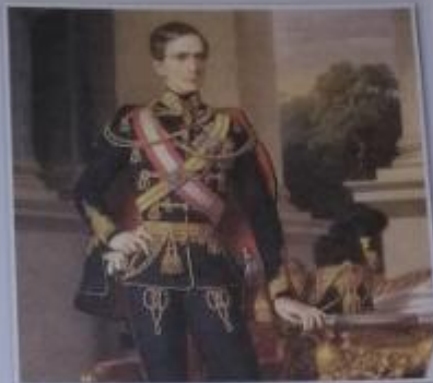
Obr. 1 – František Josef I. v roce 1853 Habsburské monarchii vládl dlouhých 68 let. O rodinném životě císaře se více dozvíte na s. 95.