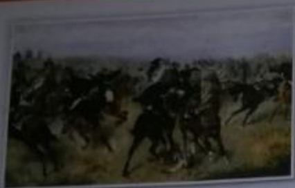
Obr. 1 – Bitva u Hradce Králové Více jste se o bitvě dozvěděli již na s. 89. Mírová smlouva mezi Pruskem a Rakouskem sjednaná předběžně v Mikulově byla potvrzena v srpnu 1866 v Praze v hotelu Modrá hvězda (ten stával v dnešní ulici Na Příkopech).

Obr. 2 – Rakousko-Uhersko Dohoda o rakousko-uherském vyrovnání dala vzniknout dvěma celkům. Část hranice tvořila říčka Litava, podle níž se hovořilo o Předlitavsku (rakouské země, české země, Halič, Bukovina, Dalmácie) a Zalitavsku (Uhry včetně dnešního Slovenska, Sedmihradsko, Chorvatsko). Od roku 1878 okupovalo Rakousko-Uhersko vojensky Bosnu a Hercegovinu.