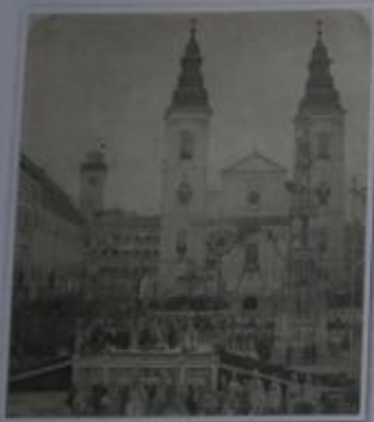
Obr. 3 Fotografie korunovační přísahy v Budíně

Obr. 2 – Rakousko-Uhersko Dohoda o rakousko-uherském vyrovnání dala vzniknout dvěma celkům. Část hranice tvořila říčka Litava, podle níž se hovořilo o Předlitavsku (rakouské země, české země, Halič, Bukovina, Dalmácie) a Zalitavsku (Uhry včetně dnešního Slovenska, Sedmihradsko, Chorvatsko). Od roku 1878 okupovalo Rakousko-Uhersko vojensky Bosnu a Hercegovinu.