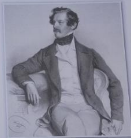
Obr. 2 – Alexander Bach Rakouský politik byl nejprve ministrem spravedlnosti a později v letech 1849–1859 ministrem vnitra v Rakouském císařství.

četnictvo = doba současné policie, vojensky organizovaný bezpečnostní sbor diplom = panovnícká listina potvrzující nějakou státoprávní skutečnost kompenzovat = vynahradit reorganizace = změna uspořádání stabilizovat = ustálit, upevnit