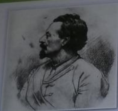
Obr. 4 – Miroslav Tyrš Tento profesor dějin se podílel na založení tělovýchovného spolku Sokol, který se řídil heslem „Ve zdravém těle zdravý duch.“