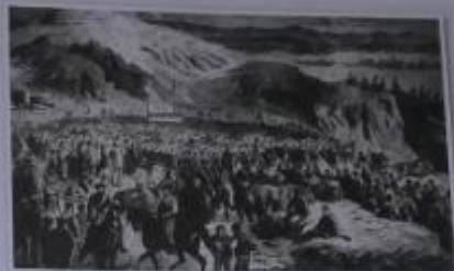
Obr. 1 – Tábory lidu na hoře Mužský

První z tzv. táborů lidu, akcí zasazujících se o boj za české státní právo, se konal na hoře Říp v květnu 1868. Na závěr tohoto shromáždění bylo přijato usnesení požadující mimo jiné vypsání voleb pro nový sněm českého království, který by vypracoval novou ústavu království, která by zajišťovala takovou samostatnost a svobodu, jako měly země Zalitavska.