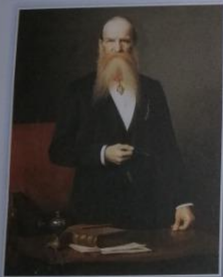
Obr. 5 – Josef Hlávka Josef Hlávka se proslavil jako architekt, stavitel, politik a mecenáš. Mimo jiné založil Českou akademii pro vědu, slovesnost a umění, která se stala předchůdkyní dnešní Akademie věd. Jako mecenáš proslul díky velmi promyšlenému programu zaměřenému na podporu kultury a vzdělanosti v českých zemích.