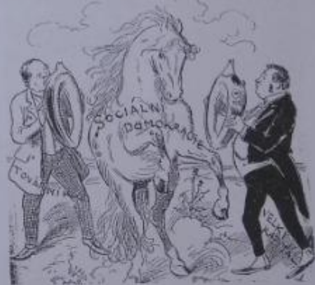
Obr. 2 – Sociální demokraté

Tato politická strana je spojovaná od svého počátku s dělnickým hnutím . Dělnici se snažili zlepšit své pracovní podmínky a postavení ve společnosti, proto se rozhodli založit svoji stranu. Nesla název Československá sociálně demokratická strana dělnická . Za nejdůležitější úkoly považovali sociální demokraté zavedení osmihodinové pracovní doby a všeobecného hlasovacího práva.