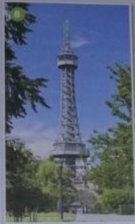
Obr. 6, 7, 8 – Průmyslový palác v Praze, Křižíkova fontána, Petřínská rozhledna

V roce 1891 se konala v Praze Jubilejní zemská výstava, kde byla prezentována úroveň českých hospodářských, technických a uměleckých výsledků. U příležitosti výstavy byly vybudovány například Průmyslový palác, Křižíkova fontána, lanovky na Letnou a na Petřín, elektrická dráha na Letné, či Petřínská rozhledna (→ s. 106).