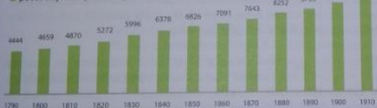
Obr. 3 – Vývoj počtu obyvatel v českých zemích

Na grafu vidíš, jak se vyvíjela populace českých zemí.