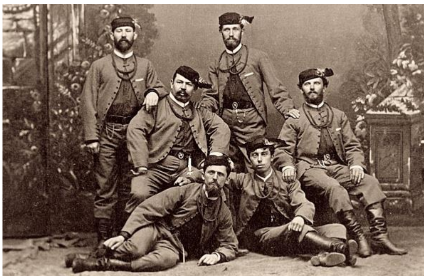
Fotka vlevo Vojta Náprstek, fotka vpravo Miroslav Tyrš, Sokolové v kroji