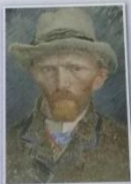
Obr. 12 - V. van Gogh - Autoportrét

Postimpresionismus Koncem 19. století nastupuje po impresionistech další generace umělců, kteří se označují jako postimpresionisté. Patří k nim například Vincent van Gogh [fan choch] (→ Obr. 12, 13) či Paul Gauguin [pól gogén] (→ Obr. 14).