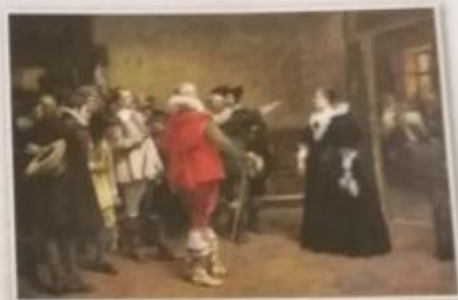
Obr. 16 – V. Brožík – Polyxena z Lobkovic ochraňuje ve svém domě královské mistodržící Slávotu a Martinice Brožík dosáhl značného úspěchu a ve své době byl ctěn jako největší český žijící malíř, dokonce byl povýšen do šlechtického stavu. • Která historická událost byla námětem Brožíkovy obrazu?