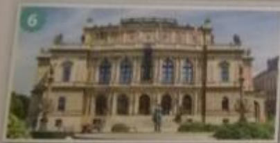
Obr. 4, 5, 6 – Novorenesanční stavby

Národní divadlo je dílem architekta Josefa Zítka. Základní kámen byl položen v roce 1868, divadlo bylo otevřeno v roce 1881. Po několika odehraných představeních následovaly dokončovací práce, během nichž došlo k požáru. Znovu otevřeno bylo divadlo v roce 1883. Národní muzeum je dílem architekta Josefa Schulze