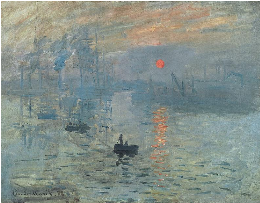
Symbol impresionismu – Claude Monet – Imprese, východ slunce