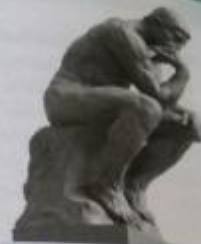
Obr. 11 - A. Rodin - Myslitel

Impresionismus S postupem doby a také s rozvojem fotografie, která skutečnost zachycovala realisticky, se objevují nové umělecké směry, které se snaží vyjádřit vnitřní pocity, nálady a dojmy z okolního světa. Nejvýrazněji se v této době uplatnil impresionismus , který vznikl ve Francii. K nejvýznamnějším impresionistickým malířům patřili Francouzi Claude Monet [klód mone], Auguste Renoir [ógist renoár] či Edgar Degas [dega]. Impresionistům již nešlo o co nejuvěrnější zpodobnění hmoty, ale o zachycení pocitů, dojmů a atmosféry okamžiku a toho, jak se atmosféra měnila účinkem světla (například během dne nebo v různých ročních obdobích). Na jejich obrazech vidíme většinou jednoduché scény z každodenního života a přírodní scénérie (→ Obr. 9). Často také nepracovali v ateliérech, ale venku . Snaha postihnout jedinečnou atmosféru okamžiku měla vliv také na odlišnou malířskou techniku - zachycení rychlými tahy štětce, použití čistých nemíchaných barev a podřízení detailů celkovému účinku (→ Obr. 10). Impresionismus měl vliv rovněž v sochařství, jedním z nejvýznamnějších sochařů této doby byl Francouz Auguste Rodin [ógist rodén] (→ Obr. 11).