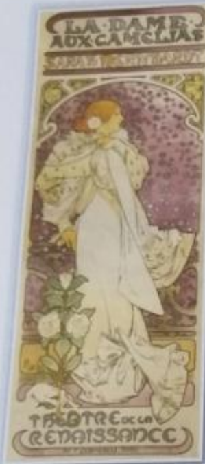
Obr. 20 – Plakát Alfonse Muchy k divadelní hře Dáma s kaméliemi A. Mucha se za svého působení v Paříži prosla- vil divadelní- mi plakáty . Později byl také autorem návrhů prvních známek a bankovek nově vzniklé Českosloven- ské republiky a vytvořil rozsáhlý cyklus obrazů nazva- ný Slovenská epopej .

amatér = ten, kdo se věnuje určité činnosti ze záliby, ne z povolání avantgarda = novátorské umělecké směry 20. století