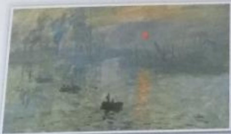
Obr. 9 - C. Monet - Imprese: východ slunce Název obrazu zachycujícího přístav v ranní mlze použili kritikové k tomu, aby posměšně pojmenovali nový umělecký směr. Označení impresionismus uměleckému směru již zůstalo a nakonec si získal respekt a uznání.

• Porovnej Courbetovo dílo s obrazem J. M. V. Turnera na s. 71. V čem se liší?