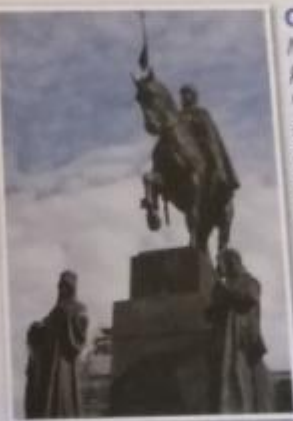
Obr. 18 – J. V. Myslbek – Pomník svatého Václava Sousoší, které je symbolem české státnosti, bylo odhaleno v roce 1912. Jeho součástí jsou také sochy sv. Ludmily, sv. Prokopa, sv. Vojtěcha a sv. Anežky.