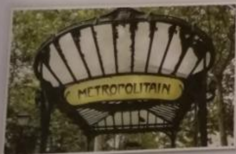
Obr. 17 – Vchod do pařížského metra Pařížské metro bylo otevřeno v souvislosti se Světovou výstavou v roce 1900 . Tyto vchody do jednotlivých stanic byly vytvořeny v secesním slohu a jsou vyrobeny z litiny. Využití nových materiálů je dalším typickým znakem secese.