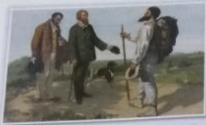
Obr. 8 - Gustave Courbet (žistáv kurbé) - Setkání aneb „Bonjour, Monsieur Courbet“ (bonžúr mesjé)

Malíř na tomto obraze zachytil sám sebe, jak putuje po venkově, při setkání se svým přítelem. Na obraze nenajdeme žádné průmyslné pózy, působivé barvy či kontrasty, autor naopak usiluje o opravdovost bez příkras.