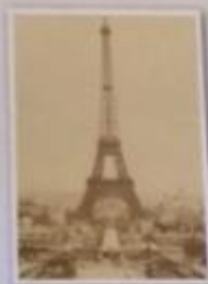
Obr. 7 – Eiffelova věž V roce 1900 se v Paříži konala Světová výstava, kterou navštívilo na 50 milionů lidí a bylo možné na ni zhlédnout prakticky vše, co bylo objeveno a vynalezeno ve světě vědy a techniky. Dominantou celého areálu byla Eiffelova věž, nejvyšší stavba tehdejšího světa.

Realismus Ve výtvarném umění 2. poloviny 19. století se prosadil realismus . Snahou umělců, kteří odmítali předchozí romantické pojetí, bylo zachytit reálný život bez příkras takový, jaký byl. Náměty obrazů tak byly často všední, inspirované výjevy z běžného života a každodenní práce (→ Obr. 8). Tyto obrazy mnohdy budily pohoršení, neboť jejich témata (jako například ženy pracující na poli či lamači kamene) nebyla považována za hodná „velkého umění“.