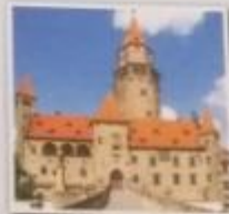
Obr. 3 – Hrad Bouzov Sklony k historismu vedly také k přestavování a rekonstrukcím starších staveb, jako byly středověké hrady. Příkladem takové romantické přestavby je například hrad Bouzov, jehož současná podoba pochází z konce 19. století.