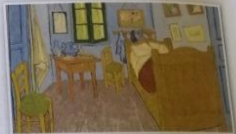
Obr. 13 - V. van Gogh - Pokoj v Arles (jaro)

Holanďan van Gogh strávil část svého uměleckého života ve Francii. Pro jeho tvorbu jsou charakteristické silně a vášnivě nanášené barvy s jasně patrnými tahy štětce. Za svého života se malíř ocenění nedočkal, prodal jen jediný obraz.