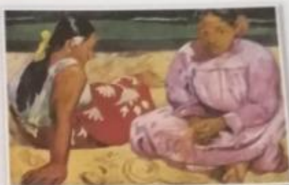
Obr. 14 – P. Gauguin – Tahitanky na pláži Francouz P. Gauguin se odebral na tichomořský ostrov Tahiti, kde hledal prostý život. I jeho díla měla působit prostě – zjednodušoval obrysy tvarů a nanášel syté barvy i na velké plochy.