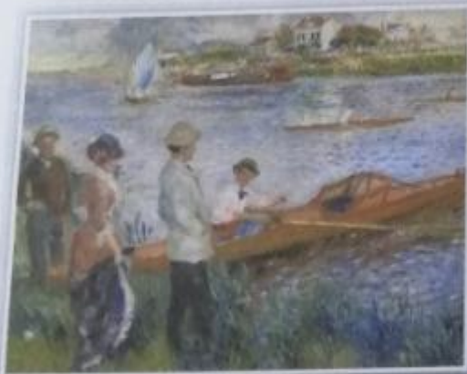
Obr. 10 - A. Renoir - Veslaři v Chatou (šatů) Impresionisté malovali tak, že detaily byly vypracovány jen v popředí, dále vzadu se tvary postupně ztrácely. Postupem času se „diváci“, pro něž byly obrazy určeny, naučili, že je třeba ustoupit od obrazu několik metrů, a získat tak celkový dojem z díla.

Impresionismus S postupem doby a také s rozvojem fotografie, která skutečnost zachycovala realisticky, se objevují nové umělecké směry, které se snaží vyjádřit vnitřní pocity, nálady a dojmy z okolního světa. Nejvýrazněji se v této době uplatnil impresionismus , který vznikl ve Francii. K nejvýznamnějším impresionistickým malířům patřili Francouzi Claude Monet [klód mone], Auguste Renoir [ógist renoár] či Edgar Degas [dega]. Impresionistům již nešlo o co nejuvěrnější zpodobnění hmoty, ale o zachycení pocitů, dojmů a atmosféry okamžiku a toho, jak se atmosféra měnila účinkem světla (například během dne nebo v různých ročních obdobích). Na jejich obrazech vidíme většinou jednoduché scény z každodenního života a přírodní scénérie (→ Obr. 9). Často také nepracovali v ateliérech, ale venku . Snaha postihnout jedinečnou atmosféru okamžiku měla vliv také na odlišnou malířskou techniku - zachycení rychlými tahy štětce, použití čistých nemíchaných barev a podřízení detailů celkovému účinku (→ Obr. 10). Impresionismus měl vliv rovněž v sochařství, jedním z nejvýznamnějších sochařů této doby byl Francouz Auguste Rodin [ógist rodén] (→ Obr. 11).