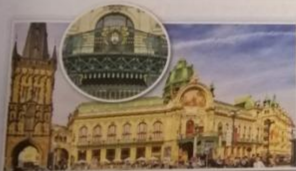
Obr. 15 – Obecní dům v Praze Příkladem secesní architektury je tato stavba, která dodnes slouží k reprezentačním účelům a pořádání kulturních akcí.

Avantgarda Na počátku 20. století se objevilo mnoho dalších uměleckých směrů, které nazýváme souhrnně avantgarda . Avantgardní umělce spojovalo odmítnutí tradice umění 19. století a snaha najít vlastní cestu k vyjádření . Tyto umělecké slohy se naplno rozvinuly v 1. polovině 20. století, proto se s nimi seznámíte až v 9. ročníku.