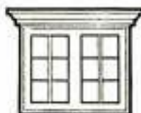
5 SDRŽENÁ OKNA

pilířů) v přímém k státní stříhlém a o- přednější v potroch ● 7 Technika sgrafito spočívá v užití dvojitě vyřezané omítky, jejíž vrchní (vnější) vrstva se za stěhu prokrabuje na spodní (vnější) zasklení vrstvy. ● 8 Městské domy stavené nebo přestavované po požárech ovlivňují město, vrchol štíty nebo arkádami, jsou označeny domovními znameními a pokryté sgrafitem nebo malbou.