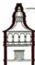
1 VEŽ S ARKÁDOVÝM OCHOZEM