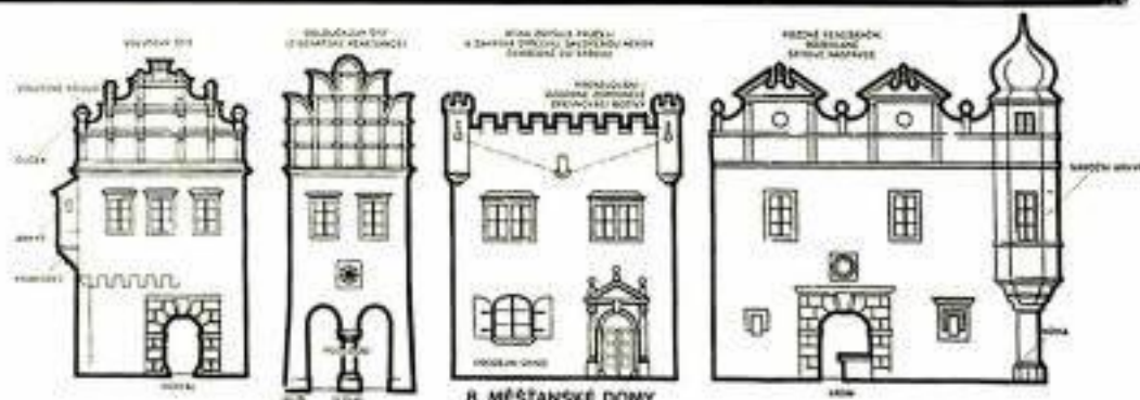
8 MĚŠTÁNSKÉ DOMY